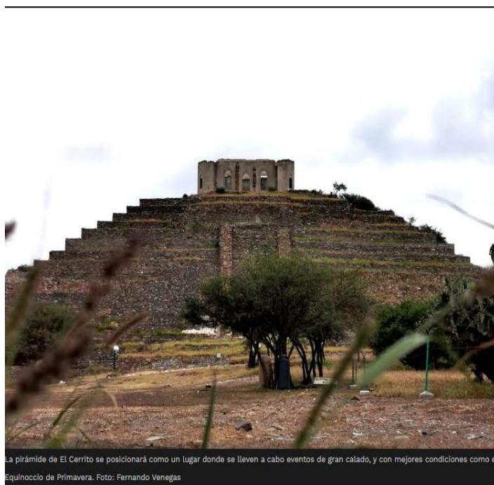
La pirámide de El Cerrito se posicionará como un lugar donde se llaven a cabo eventos de gran calado, y con mejores condiciones como el Equinoccio de Primavera.