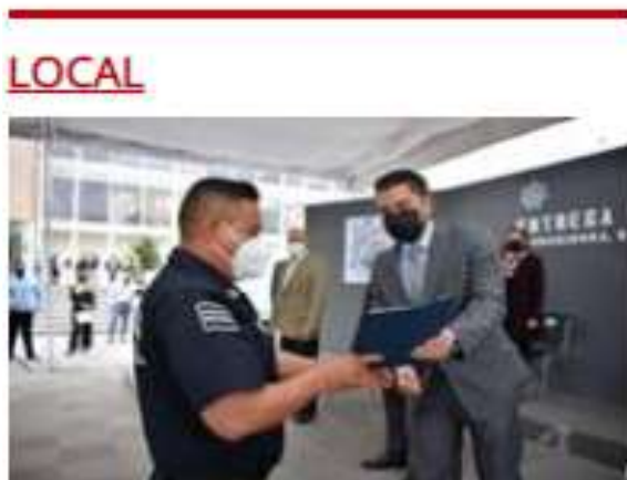
Entrega Sosa nuevos policías para Corregidora

Con la inversión se adquirirán sistemas de monitoreo y vigilancia en accesos, autopistas y carreteras para recopilación de datos de las fronteras.