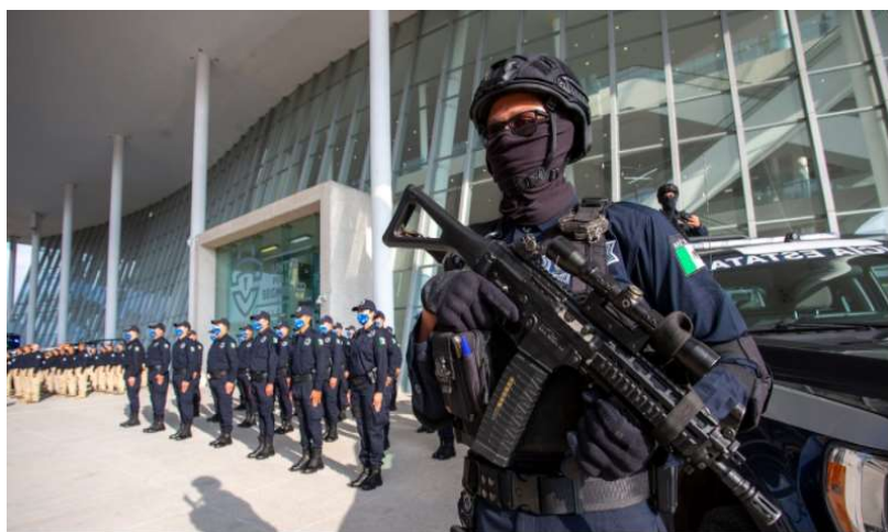
Querétaro invierte 4 mil mdp en nuevo modelo de seguridad

Los Actuales Gobiernos han definido a la Seguridad como Ejes Prioritarios de su Administración y están invirtiendo Cuatro Mil Millones de Pesos en este rubro, lo que contempla el Reforzamiento de las Fronteras Estatales, la Creación de un Centro de Comando Central, con un Área de Adiestramiento de Clase Mundial y un Centro de Capacitación con los últimos adelantos tecnológicos para la Especialización y Formación Policial, entre otra muchas otras acciones.